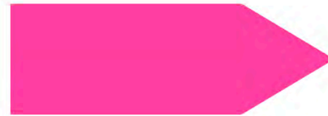
Flèche en bois