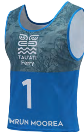
Chasuble x2 à rendre